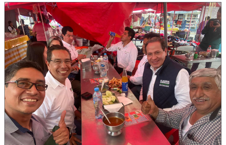
▲ El proceso electoral va avanzando en paz y tranquilidad, dijo el senador.

El 10 de octubre del año pasado, la mandataria estatal firmó el acuerdo nacional para la federalización de los servicios de salud, por lo que las acciones mencionadas son parte del proceso de cambio para dar atención a quienes no cuentan con seguridad social.