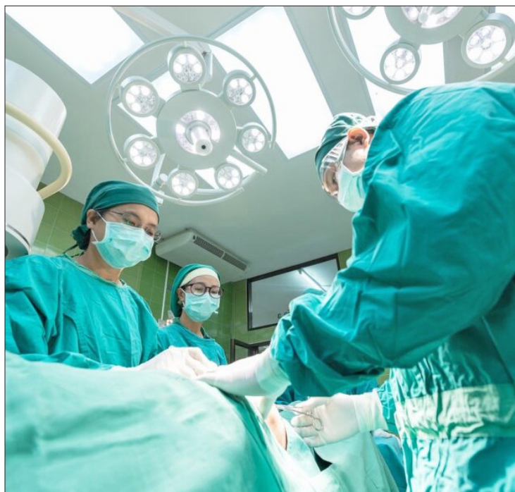
▲ Los nuevos médicos trabajarán de lunes a domingo para atender a quienes no tienen seguridad social.

Entre ellos, el Hospital General de Atenco y el Centro de Oncología