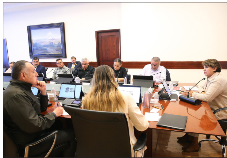
▲ La gobernadora presidió la Mesa de Coordinación para la Construcción de la Paz.

que refleja una evolución considerable en la ampliación del conjunto de habilidades requeridas debido al avance tecnológico y la complejidad de los desafíos actuales, pues ahora se especializan en áreas específicas, como criminología, derecho e informática forense, que reflejan la necesidad de una actualización constante.