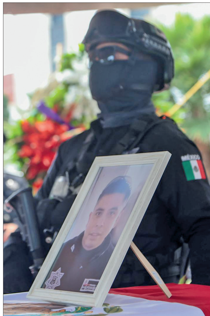
▲ El agente dejó dos hijos en edad escolar.

Su esposa lo describió como un hombre intachable