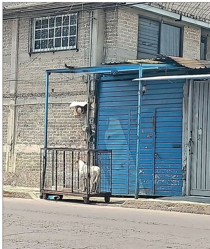
▲ Organizaciones protectoras de animales rescataron a un perro que era enjaulado y dejado en el sol.

Expuso que el golpe de calor en perros se puede identificar con los siguientes síntomas: jadeo excesivo, encías enrojecidas, saliva espumosa, vómito y diarrea, por lo que de identificarlos en las mascotas es importante que los propietarios acudan de inmediato con el médico veterinario.