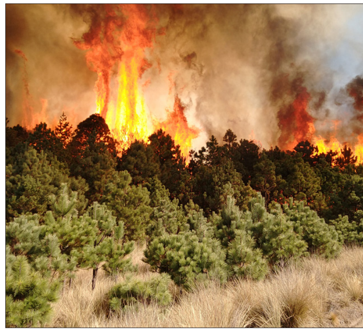
▲ La Secretaría del Campo señaló que faltan al menos 15 días de calor crítico. Foto especial

▼ Por la mañana bloquearon la avenida Alfredo Del Mazo y luego marcharon a Palacio de Gobierno. Foto especial