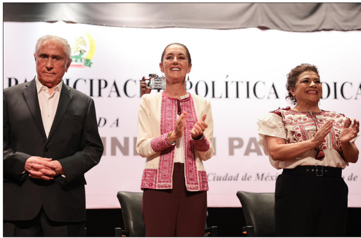
▲ La candidata expresó que los trabajadores del estado son el orgullo de México.

Durante su participación, Sheinbaum destacó la importancia de mantener un diálogo constante con los sindicatos para lograr que los trabajadores del estado sean siempre el orgullo de México. Enfatizó la necesidad de garantizar acceso a la vivienda, fortalecer el Instituto de Seguridad y Servicios