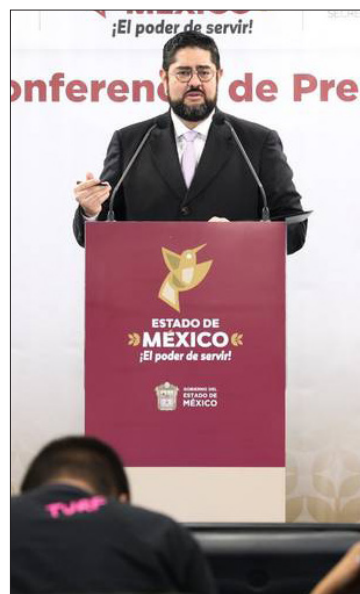
▲ Todos los casos han sido atendidos, dijo el titular de la Secretaría.

Agregó que este proyecto irá de Cuatro Caminos hasta Izcalli Chama, es un proyecto de más de 9.6 km y proporcionará una movilidad segura a más de 250 mil personas en las zonas más inaccesibles de Naucalpan, contemplando 10 estaciones y esto va a permitir que se cambie la vida, el entorno de mucha gente y se active la economía.