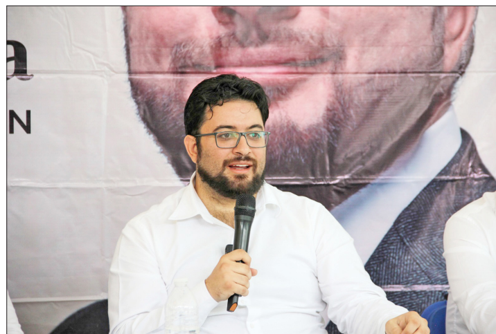
▲ El candidato de la coalición Sigamos Haciendo Historia afirmó que se garantizará el desplazamiento con calidad, seguridad, accesibilidad, oportunidad y eficiencia.

Por último, agradeció a la gobernadora, Delfina Gómez Álvarez, por la confianza y oportunidad que le ofrece al sector empresarial por lo que se comprometieron a aportar al bienestar de los mexiquenses.