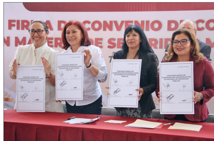
◀ Abanderadas de Morena en Ecatepec, Tecámac, Acolman y Coacalco suscribieron un convenio.