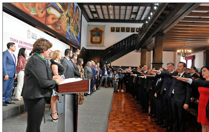
▲ La gobernadora Delfina Gómez tomó protesta a integrantes del Consejo Coordinador Empresarial.