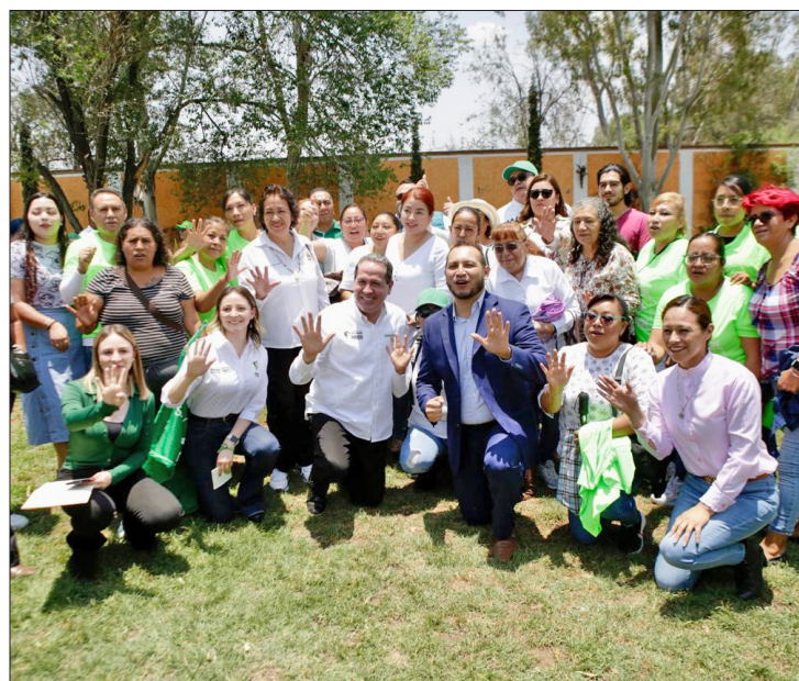
▲ El candidato del Partido Verde dijo que ya se habla de que algunos de la oposición quieren anular la elección.

Ejemplo del trabajo realizado para incrementar las condenas a quienes cometen delitos de género, destacan las sentencias vitalicias logradas en noviembre y diciembre de 2023.