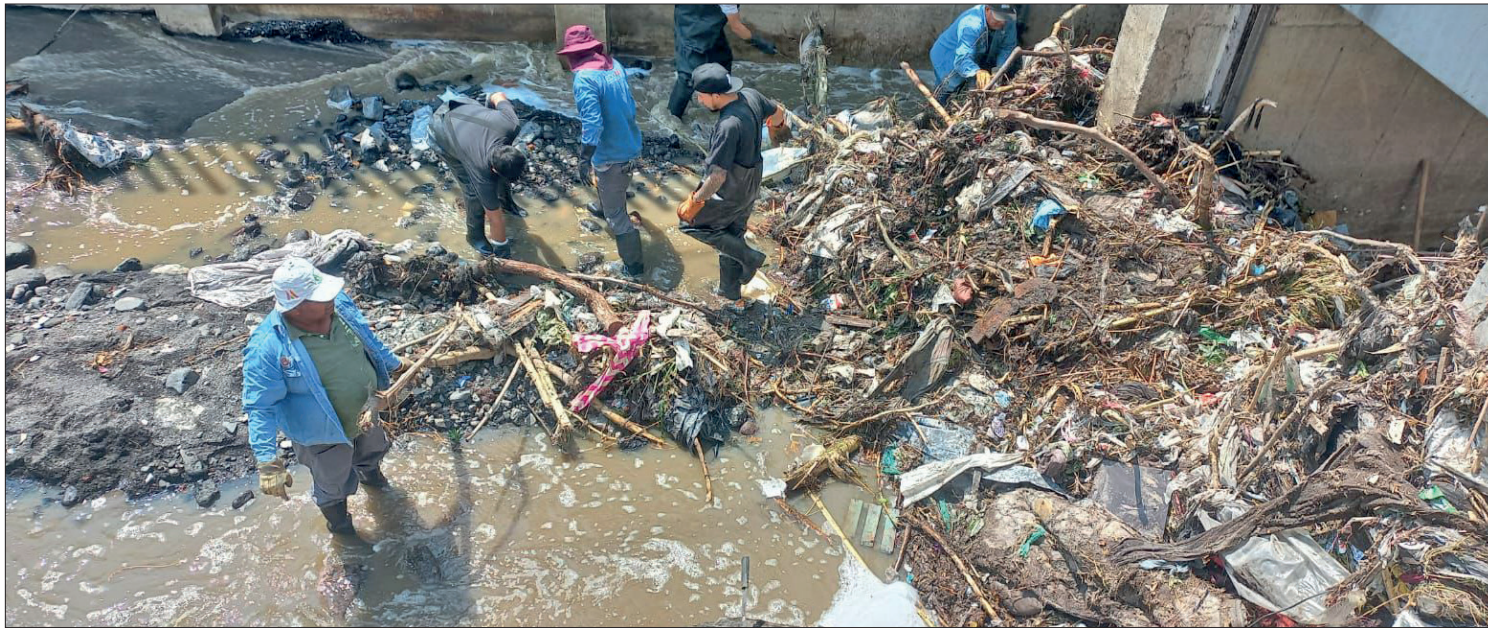
▲ En algunas zonas rentaron un trascabo para retirar los desechos.