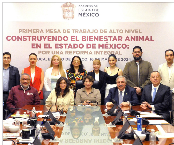
▲ La gobernadora Delfina Gómez encabeza mesa de Alto Nivel para reforma integral.