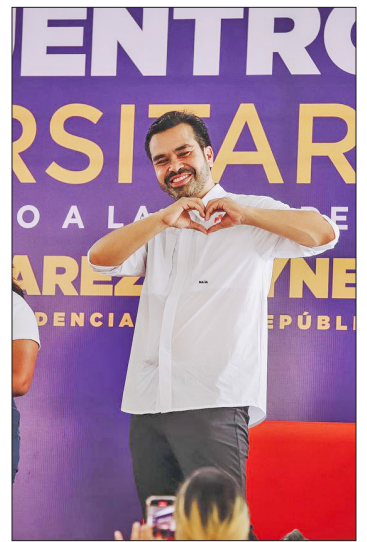
▲ El emecista se reunió con universitarios en Quintana Roo.

Aseguró sentirse muy contenta de llegar al estado, tierra del presidente Andrés Manuel López Obrador. “Siempre comprometida con Tabasco”.