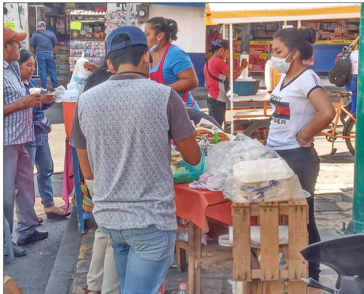
▲ Autoridades sanitarias piden a la población evitar consumir alimentos en la calle.

Esto representa un aumento respecto al año pasado, ya que en el mismo periodo se diagnosticaron a 395 pacientes con esta enferme-