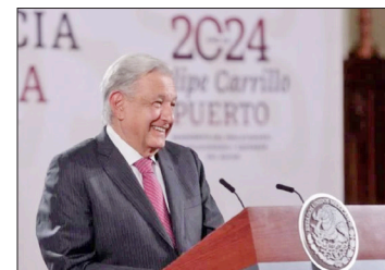
▲ El presidente describió la jornada electoral del domingo como un referéndum.

Insistió en “¿cómo vas a hablar de democracia, si no tomas en cuenta al pueblo, si crees que la democracia es lo que resuelven arriba, en la cúpula, los del poder económico y político? Eso no es democracia. Eso es lo que se va a elegir. ¿Queremos una oligarquía con fachada de democracia? o queremos una democracia auténtica. Que el pueblo decida y se beneficie de los bienes de la nación y las riquezas de México”.