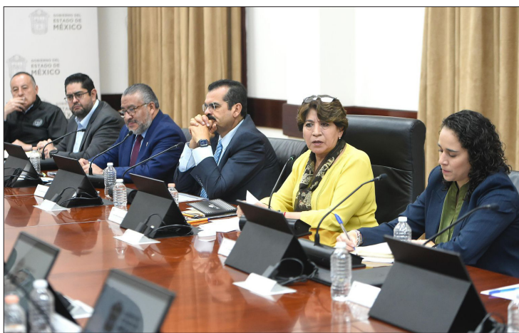
▲ La gobernadora Delfina Gómez se reunió con dirigentes de partidos y de instituciones electorales.

Entre ellas, las mesas políticas, que han sido un importante espacio de