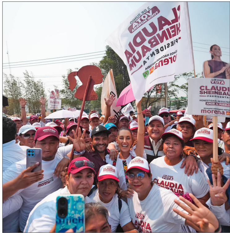
▲ Fue recibida en un ambiente festivo, con música y gritos.

“Lo que muestra es esta gran suma de mexicanos y mexicanas por la transformación”, dijo Claudia en su vista a Tabasco