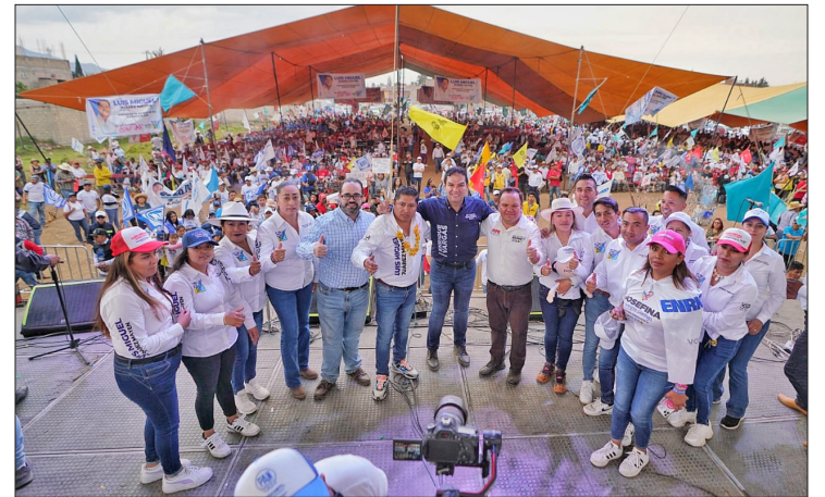
▲ El triunfo en estos municipios es contundente, pues se presentaron los mejores perfiles, dijo.

En cuanto a las personas de la tercera edad, niños pequeños y personas con discapacidad, se les debe ayudar en su cuidado e higiene personal y, en especial, en caso de procesos diarreicos.