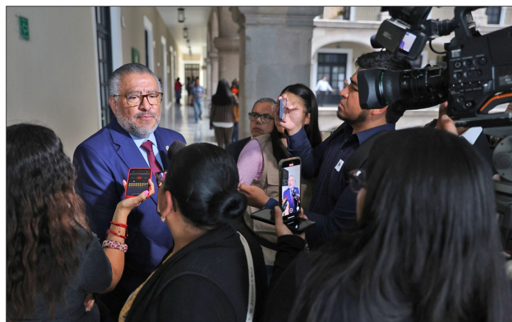
▲ El secretario general de gobierno dijo que todos los días se revisa el tema.

En coordinación con autoridades federales desarrollarán un plan de atención para garantizar la paz el 2 de junio