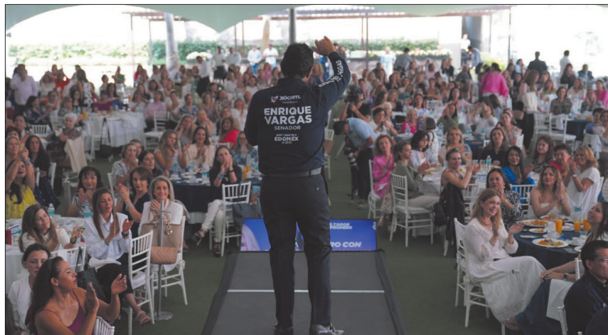
▲ Basta de ser comparsa de Morena, no tiene pretexto para no renunciar, dijo el candidato panista. Foto especial

▼ La candidata del PAN a la alcaldía de Huixquilucan anunció la construcción del “Parque La Reserva”, con grandes atracciones. Foto especial