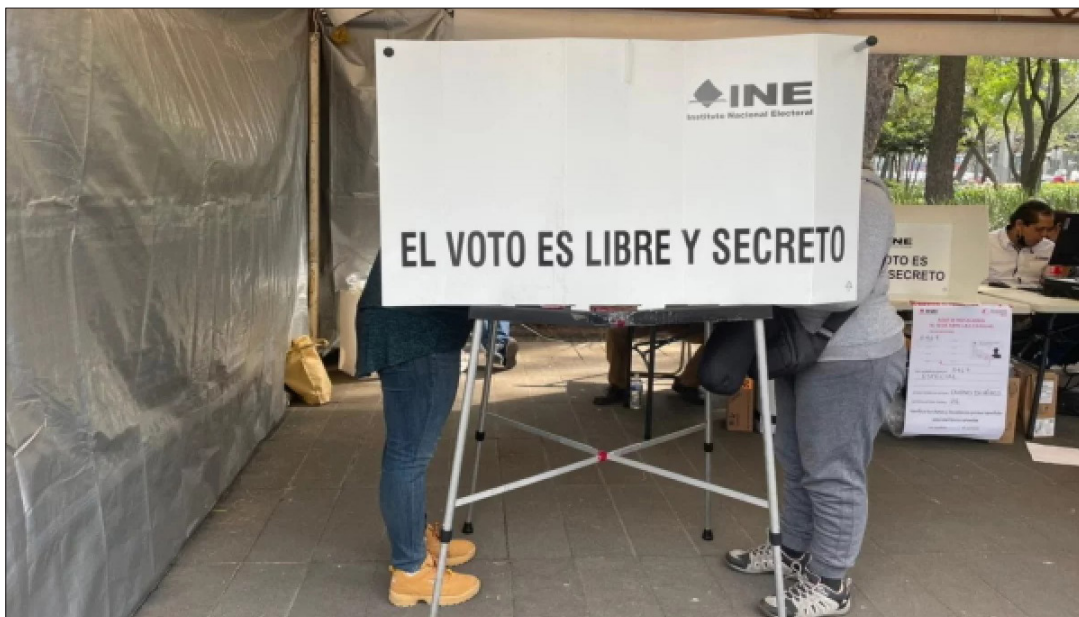
▲ El año pasado acreditó a 7 mil personas para observar las elecciones. Foto especial