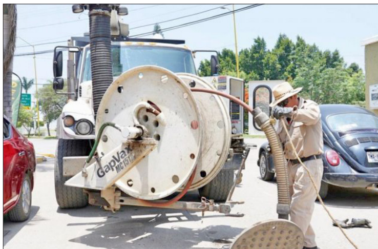
▲ La Secretaría del Agua realiza labores de desazolve de drenajes y canales a cielo abierto.

En lo que va del año se han realizado trabajos de desazolve en 549 kilómetros de drenaje y alcantarillado y en 22.63 kilómetros de canales a cielo abierto, así como la limpieza de 2 mil 317 fosas sépticas