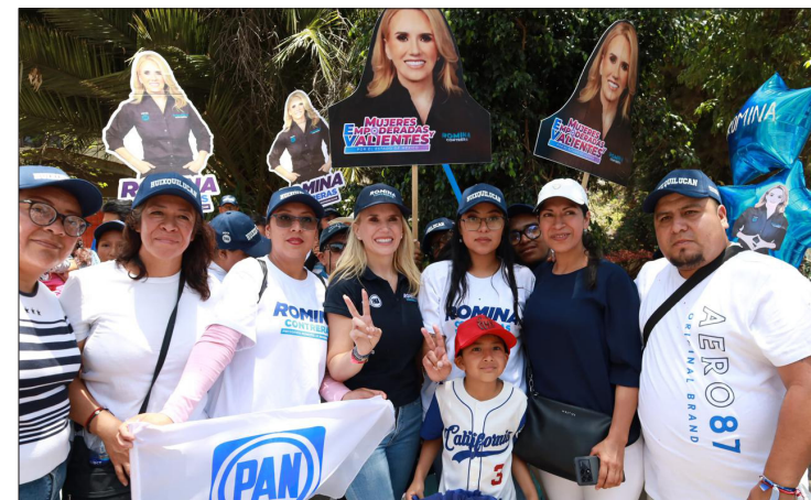
▲ Durante 21 años, ofrecieron productos naturales sin intermediarios.

En compañía de vecinos y en un ambiente de celebración, la candidata panista difundió los compromisos de su campaña, entre los que destacan: más seguridad, con la compra de más patrullas, arcos lectores de placas y cámaras de videovigilancia; atender la crisis hídrica con más pozos de agua potable; mejorar el medio ambiente, con más jornadas de reforestación; fomentar espacios al aire libre, como la creación de un parque deportivo y recreativo en la Zona Tradicional y otro en la Zona Residencial; proteger a la ciudadanía de los fenómenos naturales, con el fortalecimiento del Sistema de Alertamiento Sísmico, entre otros.