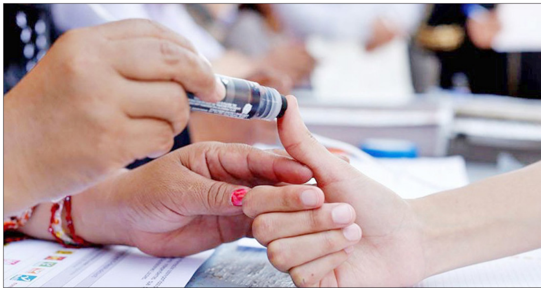
▲ Algunos negocios regalarán café al mostrar el pulgar entintado.

El objetivo de sumarse a la iniciativa es que participe el 75 por ciento del electorado, dijo Gutiérrez Alvarado