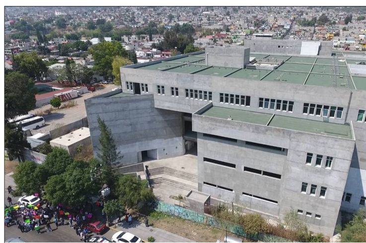
▲ Esta es la obra negra del hospital Oncológico de Ecatepec.

Se trata de nosocomios iniciados en administraciones estatales pasadas, pero que nunca se concluyeron