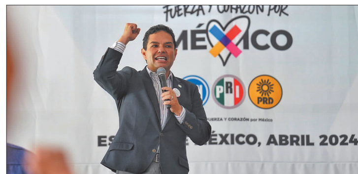
▲ Más de 2.5 millones de mexiquenses me dieron su voto y no les voy a fallar, dijo.