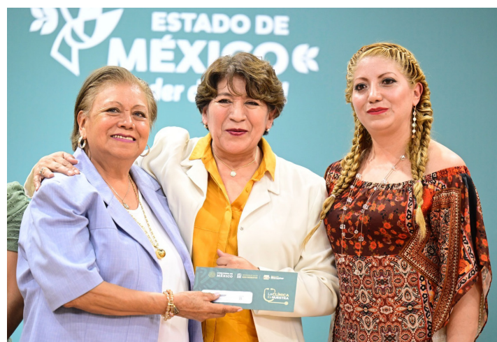
◀ La gobernadora Delfina Gómez entregó tarjetas digitales en Texcoco.

También contempla 88 Centros de Salud de más de seis consultorios, así como 75 centros de servicios especializados, y cuyos montos irán de los 400 mil a un millón de pesos.