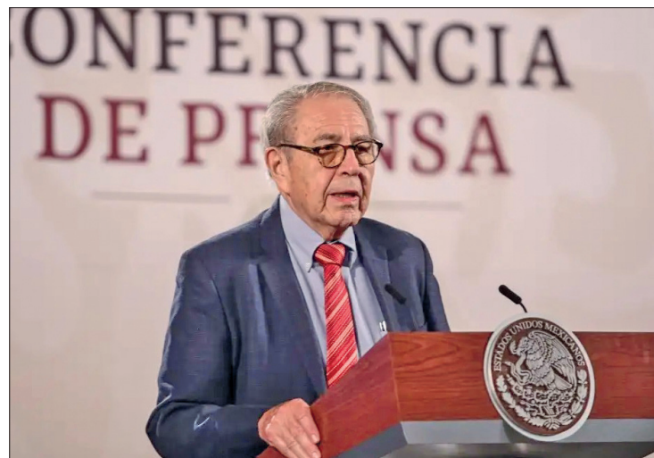
▲ El secretario de Salud abordó el tema en la conferencia mañanera del presidente López Obrador.

"Los virus de la gripe A y B circulan y causan epidemias estacionales de esta enfermedad en el ser humano, aunque solo los virus del tipo A pueden originar pandemias, según la información que se dispone actualmente", de-