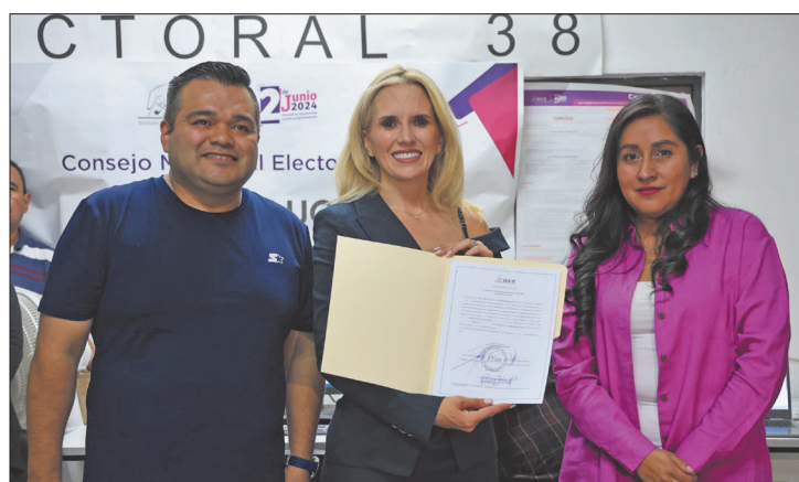
▲ Luego de concluir el cómputo de votos, el Consejo Municipal Electoral entregó dicha constancia que la acredita como presidenta municipal para el periodo 2025-2027.

“Les aseguro que no les vamos a fallar, que daremos extraordinarios resultados como lo hemos venido haciendo durante todo este tiempo. Huixquilucan es azul, Huixquilucan tuvo una votación histórica, esto es gracias a la confianza y al respaldo que ustedes nos dieron. No les vamos a fallar, seguiremos 24/7, trabajando con el mismo ímpetu y esa pasión por hacer la diferencia”, expresó.