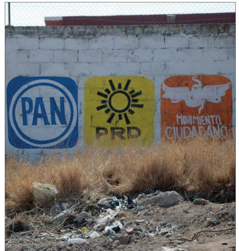
▲ En caso de no haber quitado las lonas o pintado paredes deberán asumir el costo para que lo haga el árbitro electoral.

De haber incumplido esto, el árbitro electoral realiza los trabajos y el gasto generado lo deben cubrir los institutos políticos.