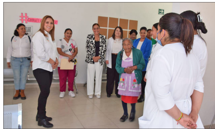
▲ Entregó paquetes de medicamentos a los centros de atención primaria a la salud.

“En ocasiones el verificador llegaba, usaba su criterio y como lo decidiera era el tamaño de la multa y por supuesto que en otras administraciones de gobierno se prestaba la corrupción, lo que nosotros queremos hacer es evitar esto, combatirlo y darle certeza a los establecimientos”, concluyó.