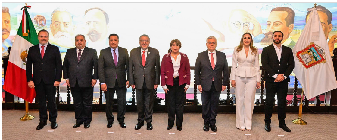
▲ En la gráfica aparece la gobernadora con los nuevos funcionarios estatales.

Certificado de Reserva otorgado por el Instituto Nacional del Derecho de Autor: 04-2020-111712383352-101