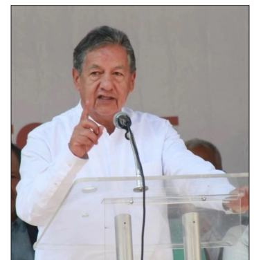
▲ “Tengo derecho a dudar de quien aún no conoce el Estado de México”, dijo el senador electo.

Además, se pronunció por una revisión interna en la Secretaría de Seguridad Pública para combatir la corrupción, limpiarla de los cientos de “aviadores” que trabajan en ésta y hacer un reordenamiento de la ubicación de los elementos para que los policías sean ubicados cerca de sus zonas de residencia, y para que se les deje de cobrar por permisos para faltar o por la asignación de una patrulla.