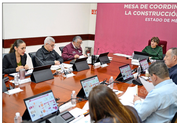
▲ Los trabajos de la Mesa fueron encabezados por la gobernadora Delfina Gómez.