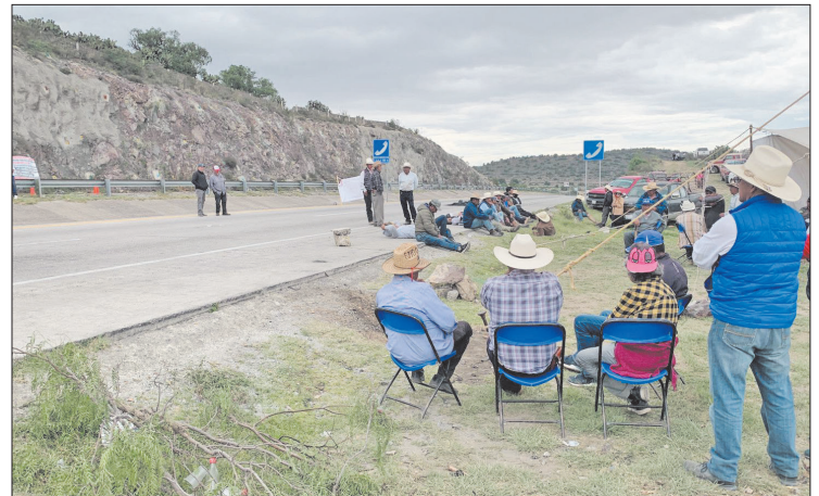
► Por tercer día consecutivo, los campesinos protestan en la carretera construida hace 18 años.

Mientras tanto en ambos sentidos de la autopista hay piedras y ramas que obstruyen la circulación.