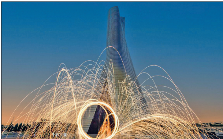
◀ El objetivo es realizar actividades culturales de manera permanente en distintos espacios. Foto especial

“Vamos a realizarlo en la red de museos del Estado de México, que son 27 del lado del Valle de Toluca y cuatro del lado del Valle de Texcoco”, concluyó.