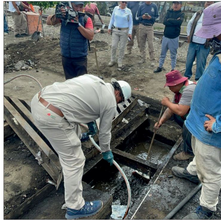
▲ Los trabajadores de Pemex tomaron muestras para analizarlas en un laboratorio.

VECINOS REPORTARON EL HECHO EL MARTES EN LA NOCHE