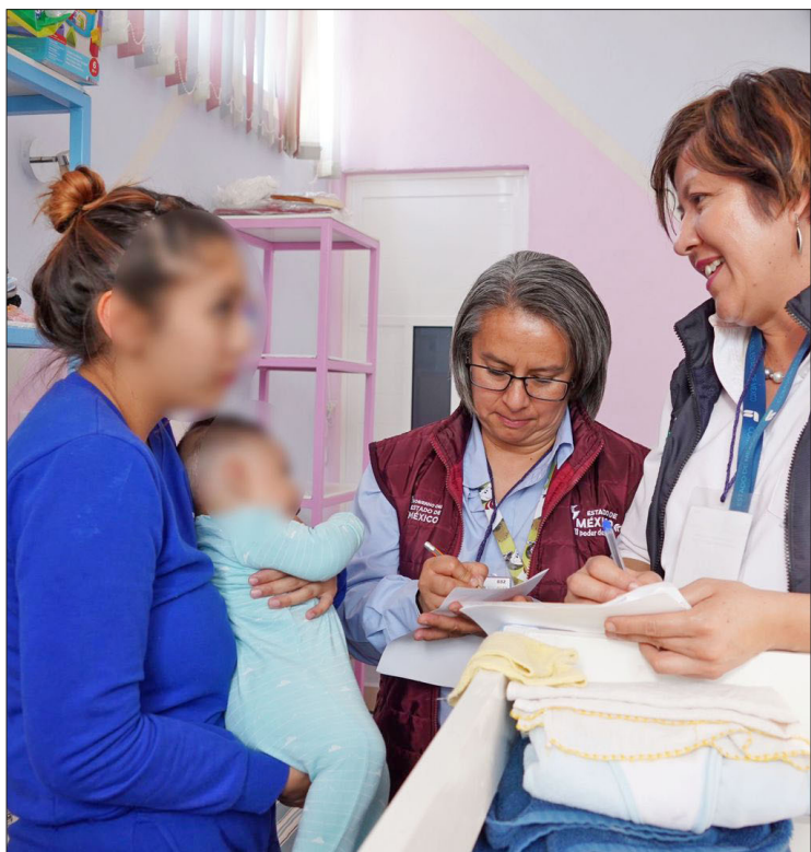
▲ Personal de la Codhem y la Procuraduría de Protección de Niñas, Niños y Adolescentes realizan visitas. Foto especial