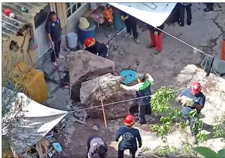
▲ Cinco piedras de gran tamaño se desplomaron del cerro en Tlalnepantla.

Desde ayer, especialistas en la demolición de rocas trabajan para convertir las piedras en un muro de amortiguamiento.