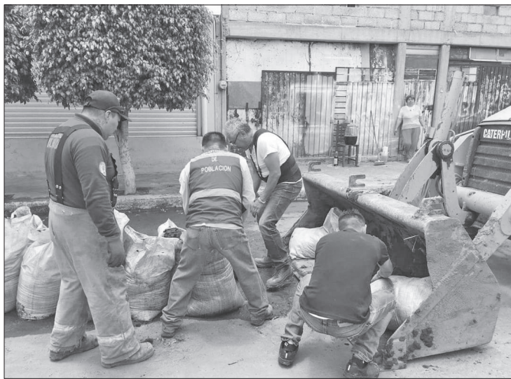
▲ Las calles van recobrando su aspecto previo a la anegación Foto especial

El sondeo y desazolve de coladeras estuvo a cargo de equipos Vacator, mediante un sistema mixto de