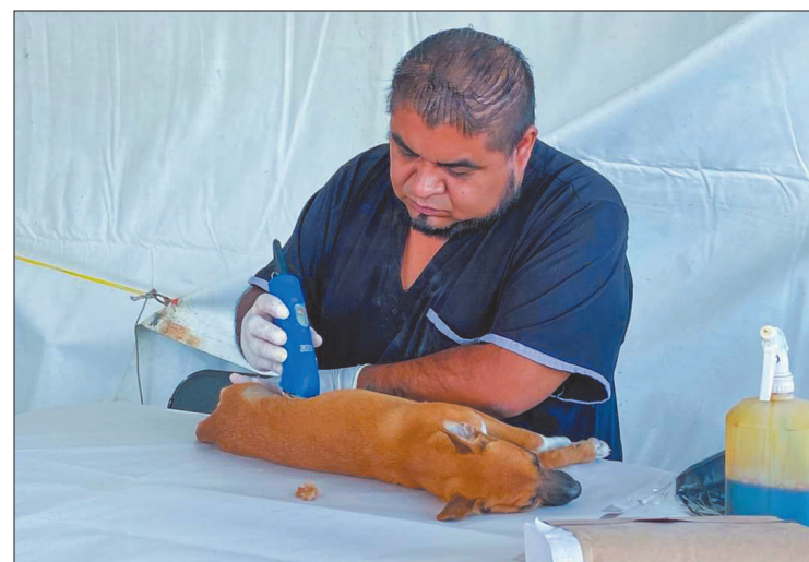
▲ El programa está integrado de tres etapas, en la segunda (en la imagen) los caninos son sometidos a la esterilización.

Y en la tercera, los animales son devueltos a las comunidades donde