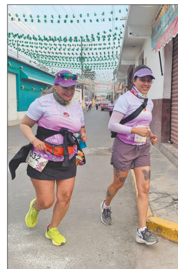
▲ La iniciativa surgió con la intención de motivar a las mujeres de todas las edades a ejercitarse.