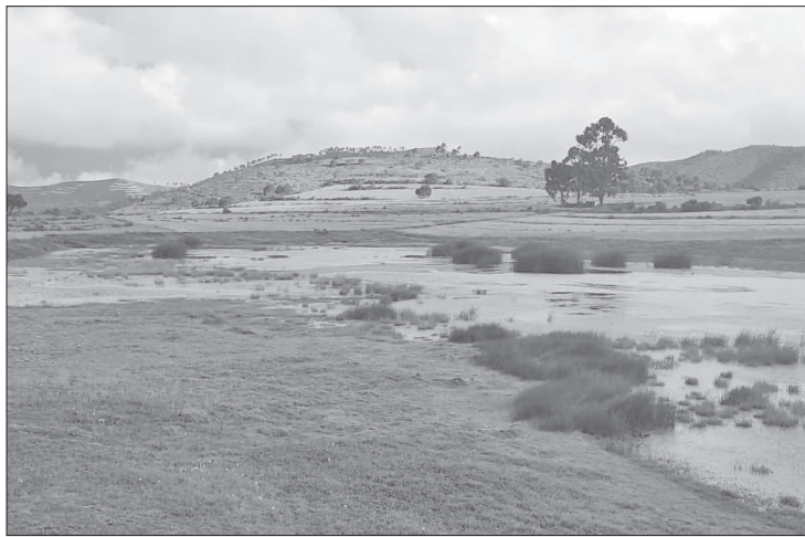
▲ Los espacios servirán para el tratamiento de aguas residuales en lugares comunitarios. Foto especial