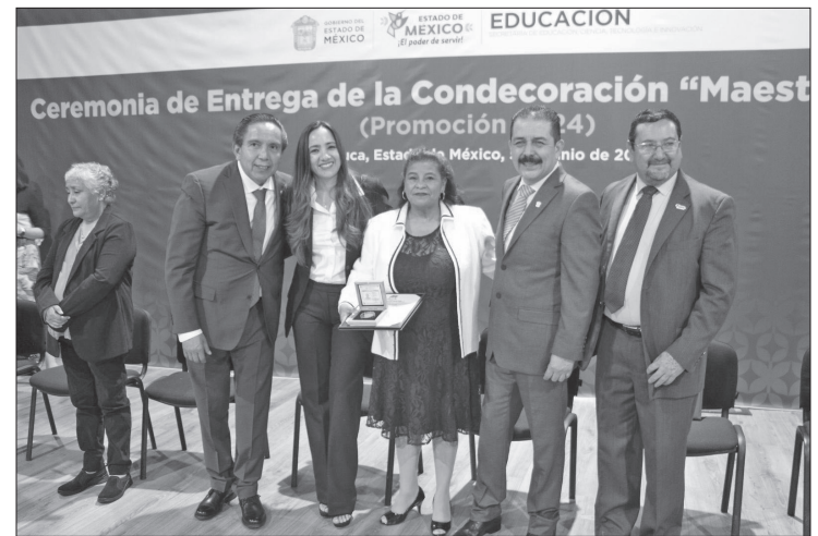
▲ El gobierno estatal y el sindicato reconocieron a 270 maestros con 40 años o más de servicio.

Incluso, la fundación Conciencia 21 creó un comité técnico para elaborar un plan ejecutivo que permita desarrollar el proyecto para que en los próximos meses esas dos comunidades tengan sus propios humedales.