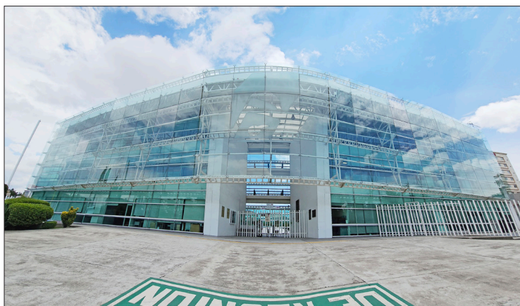
▲ Al terminar la entrega de constancias de mayoría, el IIEEM comenzará a recibir las impugnaciones.