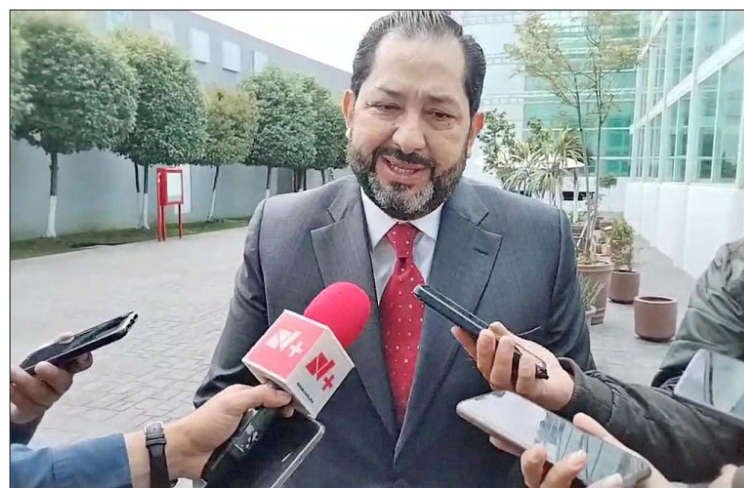
◀ El diputado local podría ser el coordinador legislativo de Morena.

Además, tendrán el control del Congreso local y con ello el partido guinda presidirá la Junta de Coordinación Política (Jucopo) en los tres años de gestión.