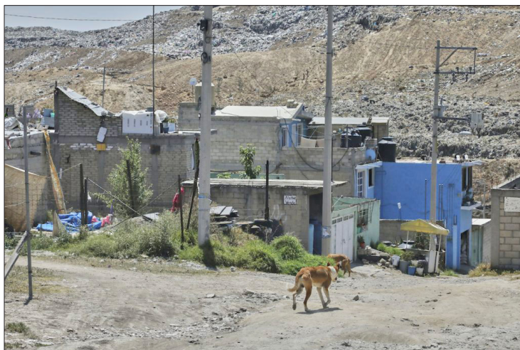
▲ La mayoría son ejidos que carecen de servicios públicos.

Destacó que el siguiente paso será realizar programas para la regularización de la tenencia de la tierra, a