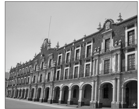
▲ El 2 de marzo de 1824 se reconoció la existencia jurídica de los Poderes Ejecutivo, Legislativo y Judicial.

CON BASE EN fuentes documentales oficiales se puede decir que el Estado de México se constituyó el 20 de diciembre de 1823 en el territorio de la Provincia de México y que el 2 de marzo de 1824 se instaló su Congreso Constituyente que reconoció la existencia jurídica de los Poderes Ejecutivo, Legislativo y Judicial y de los ayuntamientos. Cabe aclarar que en este periodo bicentenario nuestra entidad federativa dejó de funcionar por veinte años para favorecer la existencia de regímenes centralistas y que desde el 31 de enero de 1921 gozamos de gran estabilidad política y social, iniciando la incorporación de