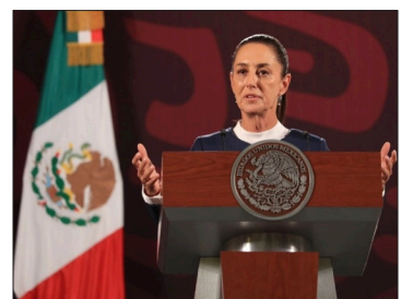
▲ Claudia Sheinbaum anunció una gira conjunta por todo el país con el presidente. Foto especial

“Nos va a dejar muy buenas finanzas el Presidente, la economía está muy bien en el país”, afirmó la virtual presidenta electa, Claudia Sheinbaum.