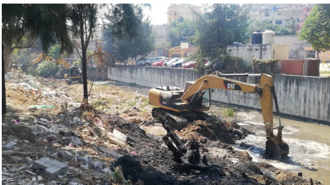
▲ Con maquinaria y a mano, los trabajadores municipales han desyerbado y retirado el azolve de los cauces.