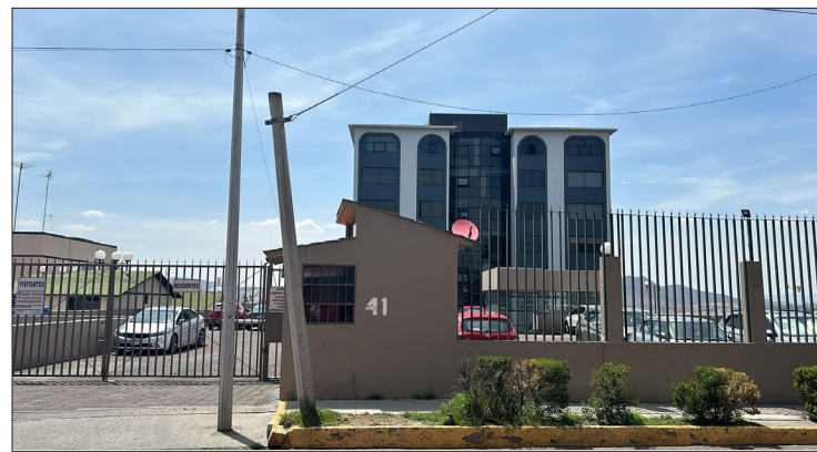
▲ Habitantes del Conjunto habitacional, acusaron a la actual administración de cobros exagerados.

Por ello el área de Comercio Establecido puso a disposición de la ciudadanía el número telefónico 55 9208 6225, extensión 136 para reportar este tipo de prácticas que podrían constituir uno o varios delitos.