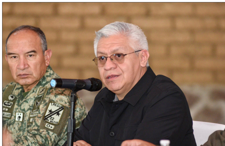
▲ Cristóbal Castañeda, titular de la Secretaría de Seguridad dijo que los resultados serán su carta de presentación.

Homicidio, feminicidio, robo de vehículos, al transporte público y de carga son los principales ilícitos a combatir