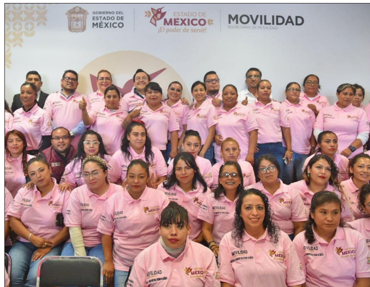
► Este es el primer grupo de mujeres que reciben capacitación para convertirse en conductoras de autobuses o camionetas.