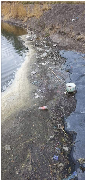
▲ En algunos cuerpos de agua del municipio empezaron a aparecer animales muertos.

Han expuesto a las autoridades en activo y al alcalde electo las siguientes demandas: saber el paradero y estado de los animales que habitan este espacio público; conocer el Plan de Rescate Integral o las acciones enfocadas a este tema; conocer las acciones enfocadas en el rescate del Espejo de los Lirios; instalación de una me-