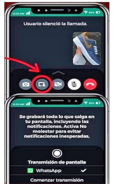
▲ En Ozumba, como en otros municipios, la policía pidió precaución a la población al contestar mensajes en su celular.

La modalidad de engaño consiste en que un contacto, ya sea usurpando el nombre de una persona conocida del usuario o con la excusa de representar a una empresa,