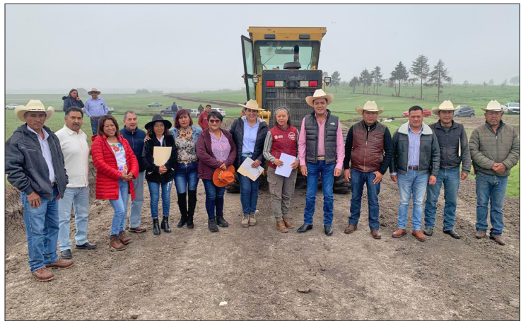
▲ El alcalde de Almoloya de Juárez y la secretaria del Campo recorrieron rastreo de caminos sacacosecha en Mayorazgo de León. Foto especial

Durante esta jornada, la secretaria del Campo y el presidente municipal escucharon algunas peticiones de ejidatarios y autoridades auxiliares, quienes reconocieron que en la presente administración se han atendido la mayoría de sus demandas.