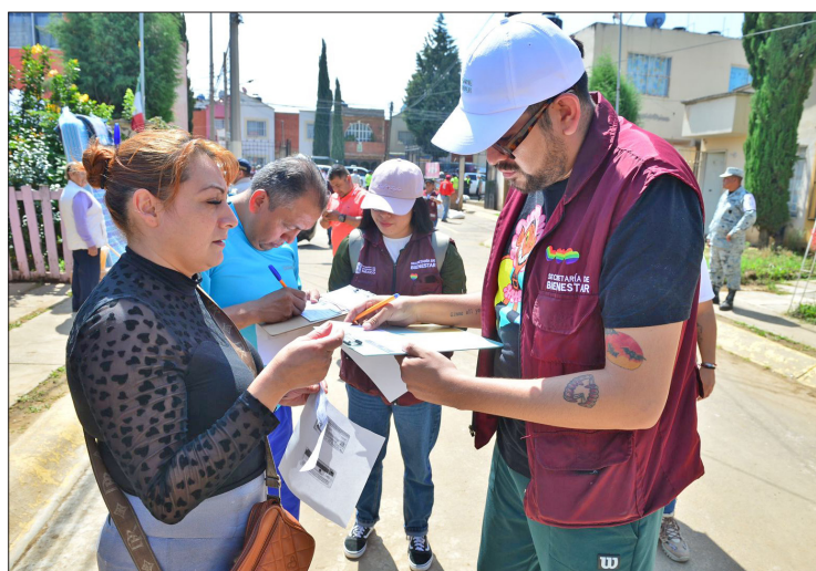
▲ En Chalco inició la entrega de apoyos a las familias damnificadas por las lluvias. Foto especial

Es resultado de la estrategia de protección implementado por la Secretaría de Seguridad; se evitó el pago del 91% del monto exigido