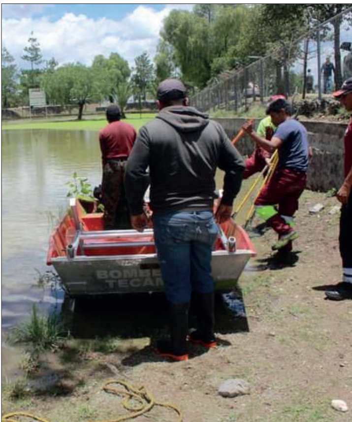
▲ Los trabajos incluyeron la remoción de residuos, así como la poda de pasto y maleza. Foto especial

Las comunidades originarias de Santo Domingo y Santa María Ajoloapan hacen referencia en sus glifos a la existencia de un apantli o estanque de agua y el axolotl o ajolote, lo que se demuestra que este anfibio ha sido relevante desde los primeros pobladores de Tecámac.