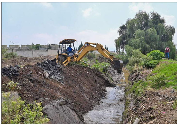
▲ Con maquinaria pesada desazolvan los cauces de ríos y canales para evitar su desbordamiento.