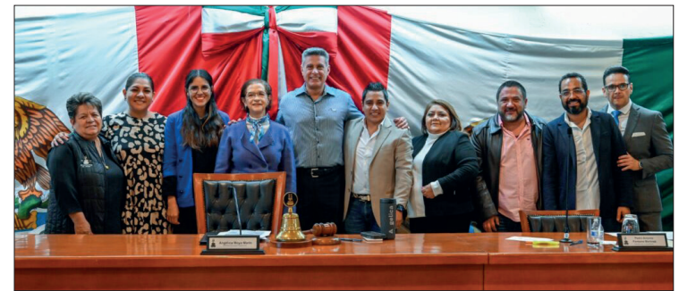
▲ En sesión de Cabildo fue aprobada la medida que aplica para pago de predial.

El pago puede realizarse en la Tesorería Municipal, de lunes a viernes de 09:00 a 17:00 horas, con excepción de los días inhábiles.