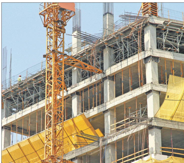
▲ Los proyectos deben cumplir con los requisitos que son validados por cinco dependencias estatales.

Maza Lara reconoció que se tienen varias peticiones de construcción de fraccionamientos habitacio-