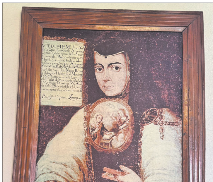
▲ En el espacio se ofrecen programas educativos y culturales para mantener viva la memoria y el impacto de Sor Juana en la literatura y la historia de México.

Se detalla que, nacida en 1651, Sor Juana vivió en esta hacienda entre los tres y los ocho años, período en el cual se dice que aprendió a leer y escribir por su cuenta, demostrando desde temprana edad su prodigioso intelecto, siendo este el lugar donde desarrolló