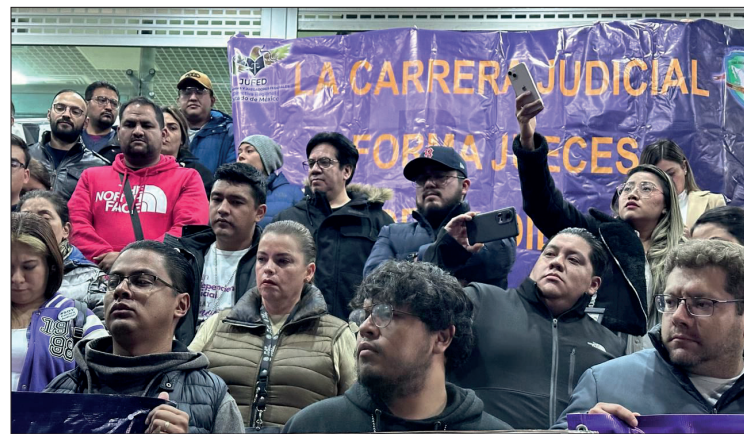
▲ Trabajadores del Poder Judicial federal en el Estado de México se unieron al paro nacional.

Minutos antes del mediodía, los inconformes aceptaron abrir de manera intermitente uno de los carriles para permitir el paso de los vehículos varados por lapsos de 5 minutos cada 40 minutos.