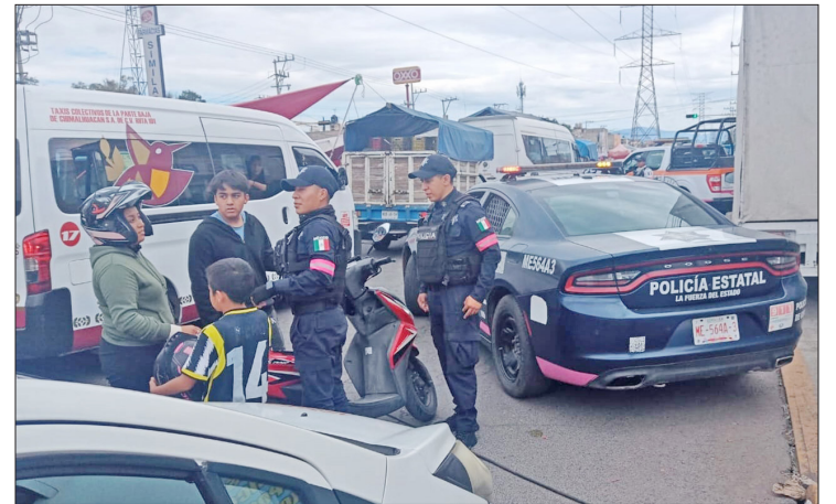
▲ Chimalhuacán es uno de los municipios mexiquenses que cuenta con doble alerta de género.

traslado de su esposa a las galeras, que hubo compra de voluntades, y esta situación la ha enfrentado a lo largo de casi 4 años.