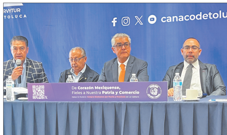
▲ Empresarios informaron que los sectores más beneficiados serán papelería, uniformes, zapaterías, ópticas y servicios de cómputo.

timo año, los productos escolares en lugar de subir bajan, más las promociones es otra de las cosas que nos permite un incremento bajo en los útiles escolares”, finalizó el empresario.