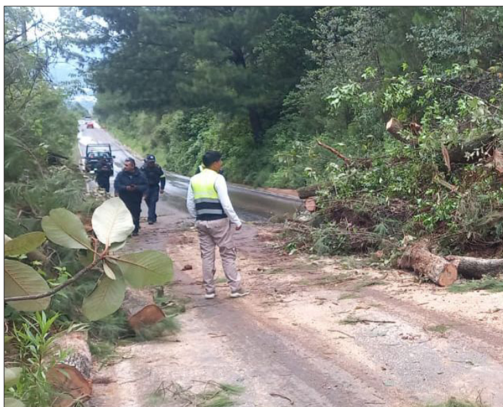
▲ Las autoridades informaron que apoyarán a los familiares de las dos personas que fallecieron en la carretera Totolmajac- Porfirio Díaz.

El funcionario añadió que los municipios susceptibles de presentar afectaciones durante la tempora-