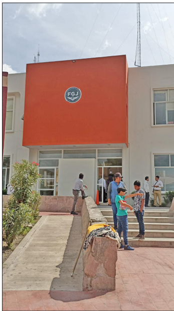
▲ A las instalaciones de la Fiscalía fue conducida la propietaria de un inmueble, a pesar de que es la parte acusadora. Foto especial

Considera demandar al M.P. y al juez de Control, aunque es mucho su desaliento piensa acudir a la Fiscalía Especializada en Combate a la Corrupción, porque observó, tras el