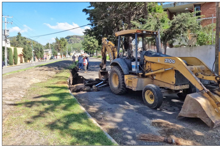
▲ Al lugar acudió personal de diversas áreas del ayuntamiento capitalino para mitigar las afectaciones.

El socavón cuenta con una longitud cercana a los cuatro metros y de acuerdo con el gobierno municipal se originó por filtraciones que desgastaron el material, en el lugar, un camión que circulaba por la avenida Adolfo López Mateos quedó atorado al hundirse la llanta