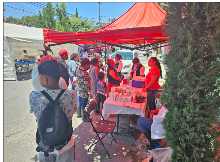
▲ Facilitan servicios de rayos X, optometría, densitometría, ultrasonido y farmacia. Foto especial

"El decir tiempos creo que sería una irresponsabilidad de mi parte, el tema es que no llovió, estamos a expensas de esa situación, esta es la parte más baja, con agua que viene de muchos lados del municipio, colonias, barrios y la propia cabecera", explicó.