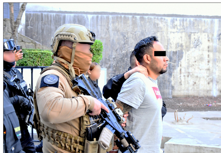
▲ Momento en el que el detenido es llevado al penal de Barrientos.