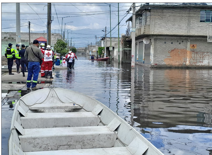
▲ Pese a que se duplicó la presencia de maquinaria y elementos, la anegación no cede.

De acuerdo con el titular de la Coordinación estatal de Protección Civil el nivel del agua en las zonas más afectadas de Culturas de México, que permanecía en 1.25 metros de tirante, hasta este medio-