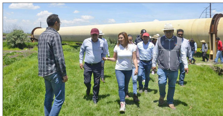
▲ En coordinación con la Conagua, CAEM y municipios de la región, iniciaron las obras para retirar la obstrucción.

En este punto trabajarán cuatro excavadoras, dos proporcionadas por San Mateo Atenco, una de Lerma y una más de Toluca; por parte de la CAEM se realizará limpieza manual y en lanchas proporcionadas por la Secretaría de Seguridad.