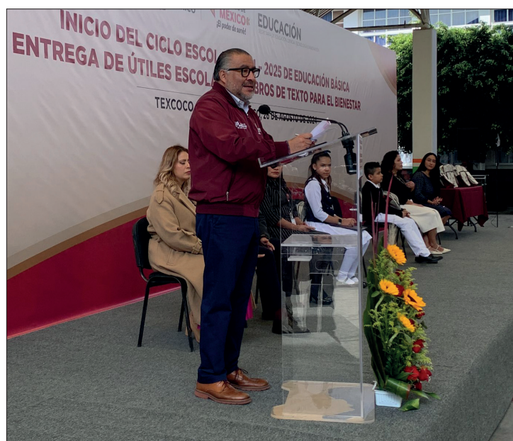
▲ El secretario general de Gobierno acudió al Centro Escolar del municipio de Texcoco.

Esta semana podría quedar desalojada la totalidad de las aguas de calles y viviendas de Chalco, prevé Duarte