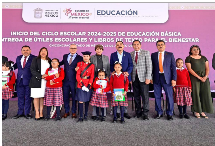
▲ La mandataria mexiquense reconoció la labor del magisterio de la entidad.

Integrantes del gabinete mexicano acudieron a las 19 regiones estatales para verificar el inicio del ciclo escolar y comenzar la distribución de Libros de Texto Gratuitos y Útiles Escolares para el Bienestar, en beneficio de más de 2.8 millones de alumnos que cursan el nivel básico en el Estado de México.