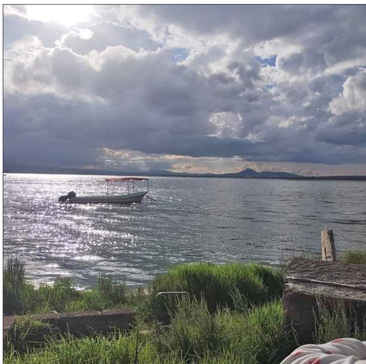
▲ Poco a poco la zona recupera su vocación turística y agrícola.

Antes del inicio del temporal, el secretario del Agua, Pedro Moczuma Barragán, asistió al Foro “Gestión de Ciclos y Fuentes Al-