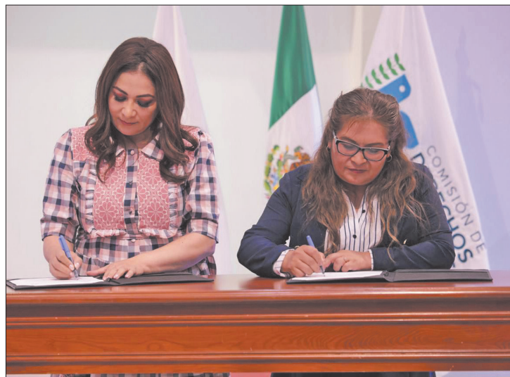
▲ La alcaldesa y la presidenta del organismo firmaron un convenio para fortalecer y respetar las garantías de la ciudadanía