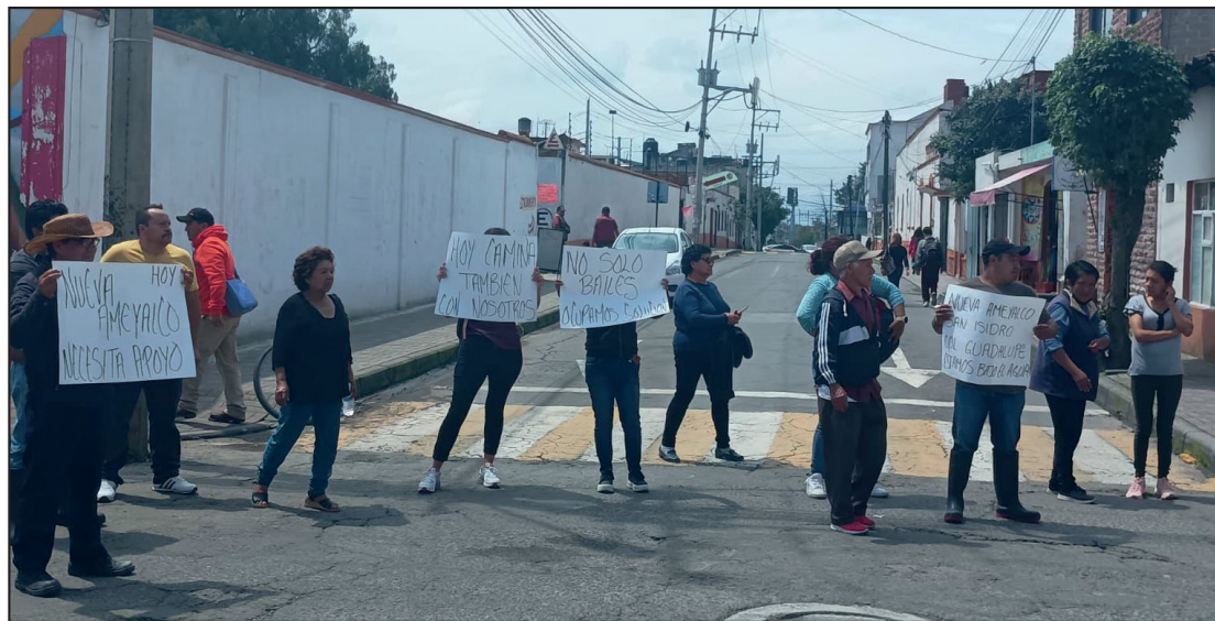
Los habitantes bloquearon la circulación en calles cercanas al Palacio Municipal.

Las colonias anegadas son Guadalupe, San Isidro, Nueva Ameyalco y Arturo Montiel, que se encuentran en la parte baja del municipio