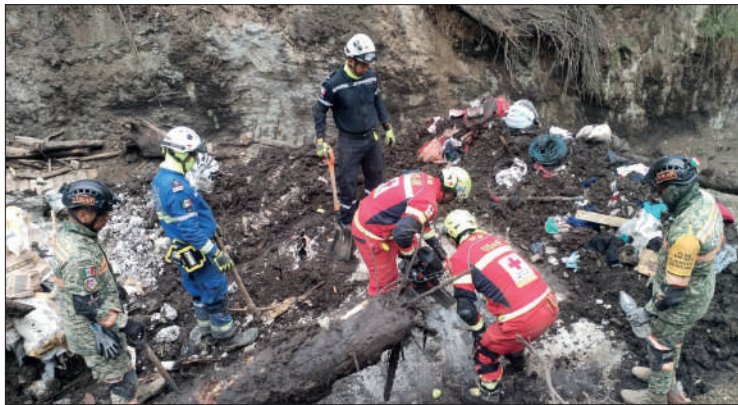
◀ Habitantes de Jilotzingo y municipios aledaños limpian la zona de desastre donde 9 personas perdieron la vida.

De igual manera, dio a conocer que se tiene el reporte de dos personas más desaparecidas; aunque no se tiene una información concreta. “Ya se hizo la búsqueda con bino-