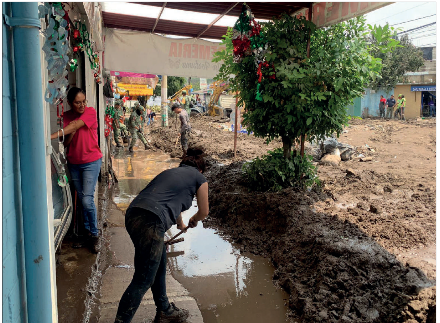
▲ Las lluvias de este fin de semana dejaron severos daños en varios municipios del Valle de México y la zona oriente de la entidad, incluyendo el saldo de nueve fallecidos en Jilotzingo donde el deslave de un cerro arrastró viviendas y varias personas. En Ecatepec las precipitaciones arrastraron lodo y de la Sierra

ALEJANDRA REYES, MIRIAM VIDAL, MIGUEL GONZÁLEZ / P. 4