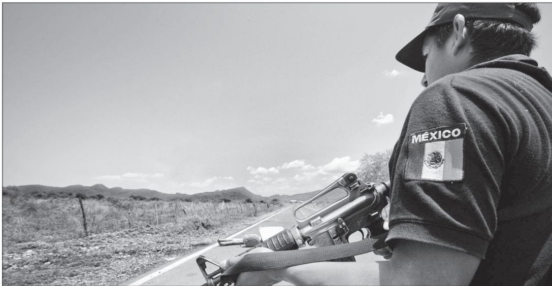
▲ Más de 30 muertos han dejado enfrentamientos entre Fuerzas Armadas y Cárteles de Los Mayos y Los Chapitos.

Por su parte, la fiscal General del Estado de Sinaloa, Claudia Zulema Sánchez Kondo, declaró que desde el 9 de septiembre se han registrado 37 personas privadas de la libertad y se han presentado 47 denuncias por robo de vehículo, según el corte realizado hasta el día 15 del presente mes. Estos hechos, de igual manera, están relacionados a la confrontación interna del Cártel de Sinaloa, también conocido como Cártel del Pacífico.