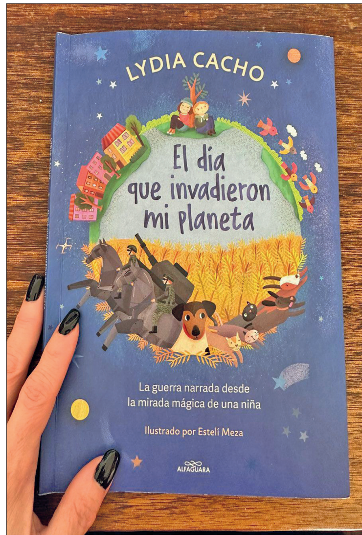
▲ El libro El día que invadieron mi planeta es editado por Alfaguara, ya está a la venta en las principales librerías del país. Foto especial

“Lo que quiero es que tanto yo como los lectores entendamos