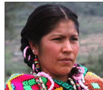
▲ Las tradiciones funerarias de los matlatzincas revelan una compleja cosmovisión en la que la muerte era vista como una transición hacia otra forma de existencia, profundamente conectada con la tierra y los ciclos de la naturaleza.

Los documentos demuestran que las prácticas funerarias de este grupo que se estableció principalmente en el Valle de Toluca, incluían ceremonias en las que se quemaba copal y se ofrecían sacrificios animales, lo que sugiere una fuerte relación entre el culto a los ancestros y las fuerzas divinas que regían la naturaleza.