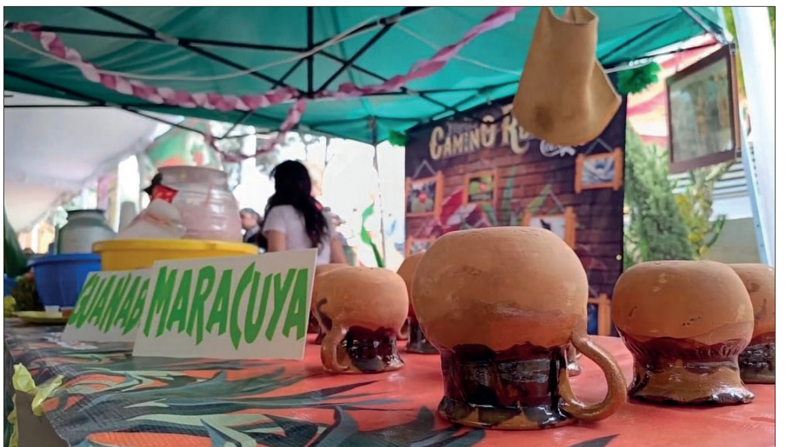
▲ Campesinos de Coatepec producen más de mil litros diarios de pulque.

La Feria del Maguey, tendrá un amplio programa artístico y cultural con danza y música.