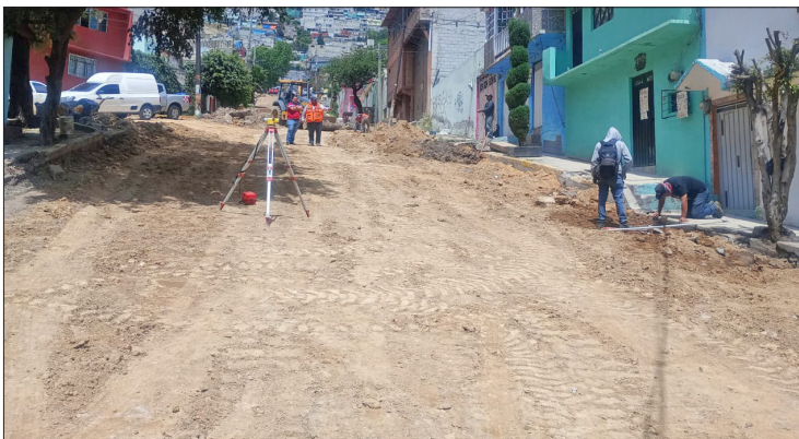
El suministro fue suspendido durante dos meses, mientras se realizaba la reparación.

Con estas obras, se busca que la totalidad de infraestructura de suministro que se encarga de dotar del vital líquido a las diferentes