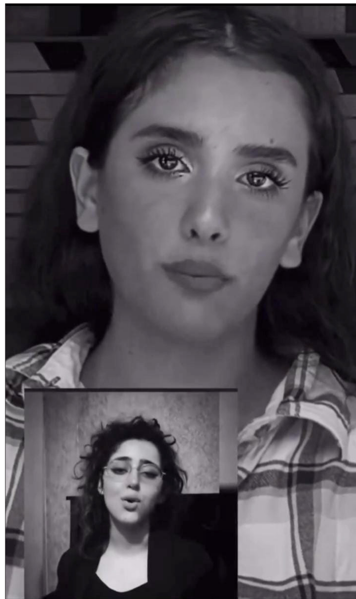
▲ Bella ciao es el nombre de una canción adoptada y compartida en redes sociales (X, en la imagen) como himno por la Resistencia.

Las mujeres pronuncian estas frases mientras sostienen carteles con el rostro tachado del líder supremo de los talibanes, el mulá Hibatullah Akhundzada, que terminan partiendo por la mitad.