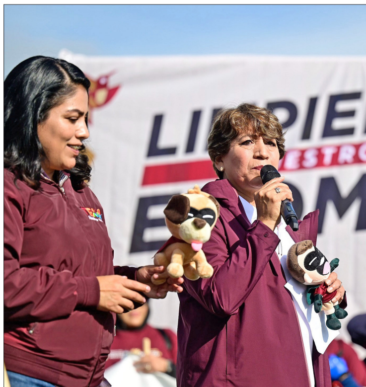
▲ Los personajes son la imagen de la campaña "Limpiemos Nuestro Edomex". Foto especial

Llegan Olimpia, Eco, Brillo y Simba para sensibilizar a niños y adultos sobre el cuidado del medio ambiente, la cultura del reciclaje, y el trabajo en equipo