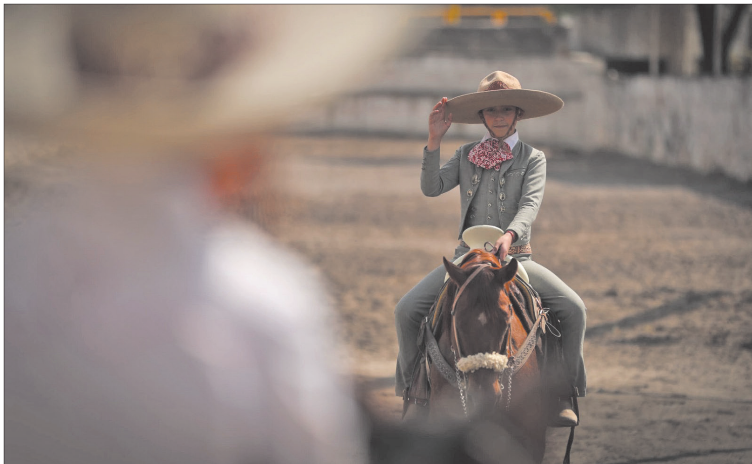
▲ En el Museo Hacienda La Pila, en Toluca, se exhiben prendas de vestir de esta actividad.