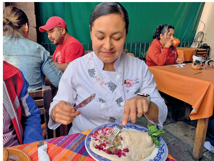
▲ Los habitantes aseguran que esta oferta culinaria atraería turismo al municipio.

“Ella es la que nos enseñó que se puede usar en varios guisos, un huevo a la mexicana, mixiote con