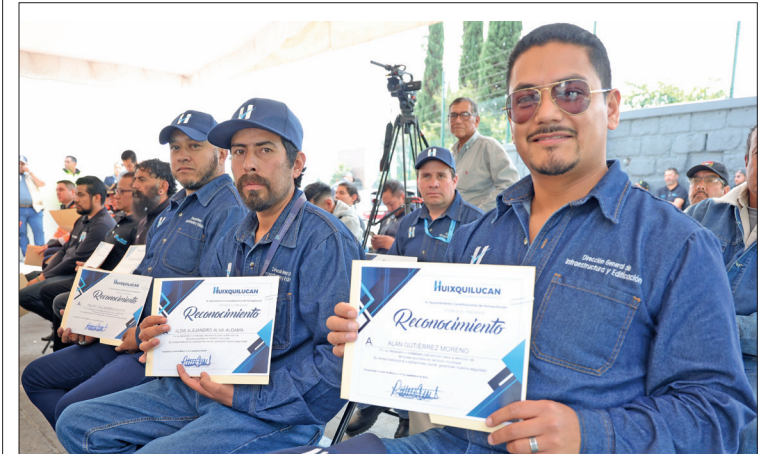
▲ Elementos de la Coordinación de Protección Civil y de las Direcciones de Gobierno e Infraestructura y Edificación de Huixquilucan fueron reconocidos por la labor de cuidado y prevención a la ciudadanía.