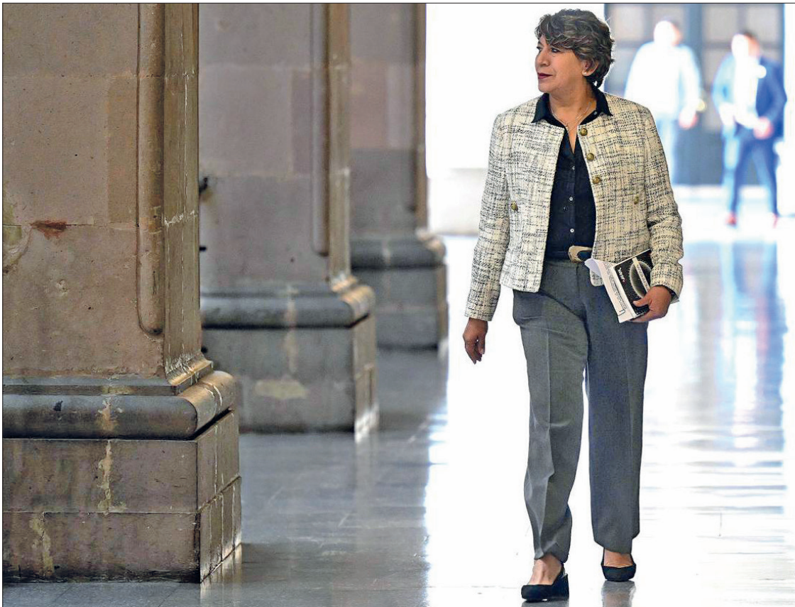
▲ A través de la encuesta "Gobernadoras y Gobernadores de México", la mandataria mexiquense se ubicó como una de las mejores.