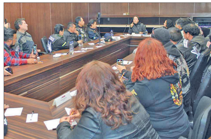
◀ Los grupos de motociclistas lograron que la iniciativa sea detenida para considerar su punto de vista.

"Van a trabajar de manera conjunta en una nueva iniciativa al respecto. Por escrito, la diputada Paola envió un documento donde solicita detener la propuesta hasta que se pueda presentar la