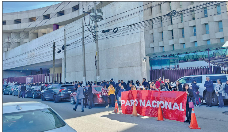
◀ Los manifestantes realizaron una cadena humana afuera de las instalaciones del Poder Judicial en Toluca en apoyo al paro nacional.

presenciales y protestas a fin de defender sus derechos laborales, así lo dio a conocer Víctor Flores Nicolás, secretario general del Sindicato de Trabajadores del Poder Judicial de la Federación con sede en Toluca.