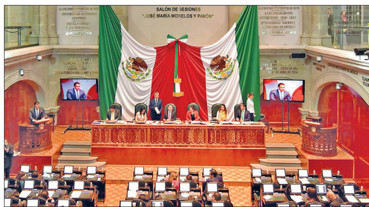
▲ La Junta de Coordinación Política (Jucopo) de la LXII Legislatura del Estado de México no tiene prisa en ajustar la reforma constitucional de la entidad.

En entrevista, el morenista aclaró que los legisladores mexiquenses primero trabajarán en ajustar el marco constitucional con las reformas federales, como las del Poder Judicial, que implica construir en 180 días las leyes secundarias en la materia.