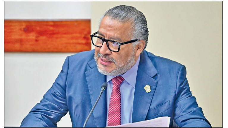
▲ El secretario general de Gobierno, Horacio Duarte Olivares, será quien abra el proceso de la glosa con su comparecencia el 9 de octubre.

Su intervención es especialmente relevante dada la crisis de inseguridad que enfrenta el Estado de México, uno de los temas más delicados para la administración