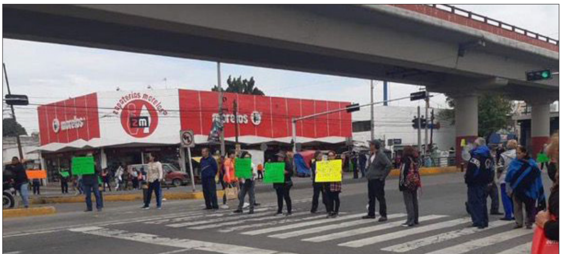
▲ Habitantes de varias colonias denunciaron que no se ha dado seguimiento a la repavimentación y la falta de acceso al agua potable. Miriam Vidal

Los afectados caminaron durante varios metros en busca de alternativas para dirigirse a sus destinos.