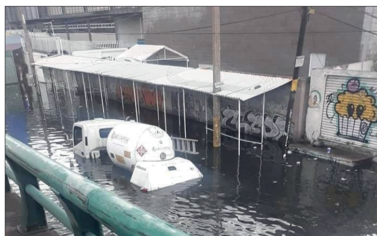
▲ En respuesta a las inundaciones que se registran en la Federal México- Texcoco se construirá un cárcamo para la contención de agua. Foto especial