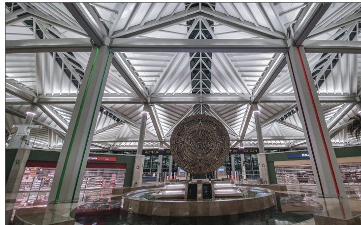
▲ El AIFA fue inaugurado en 2022 y cuenta con dos museos en su interior: el del Mamut y de la Aviación.

Se considera, desde su concepción, hasta el fomento y difusión de la cultura mexicana, con la Piedra del Sol que se ubica dentro de las instalaciones; así como los dos museos dentro del complejo aeroportuario: el del Mamut y el de Aviación.