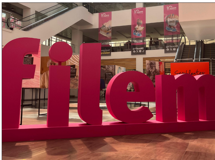
▲ Aunque las actividades de la Feria Internacional del Libro del Estado de México (FILEM) ya iniciaron, en el primer día lucía semivacía.

“Es una Feria Internacional y con esto, me parece poco respetable, a quienes asistimos, a quienes sabemos de la historia de FILEM y esperamos año con año esta reunión, pero creo que también es una falta de respeto a gente tan importante como la compañía Paso de gato. Sí pido a los organizadores revisen sus