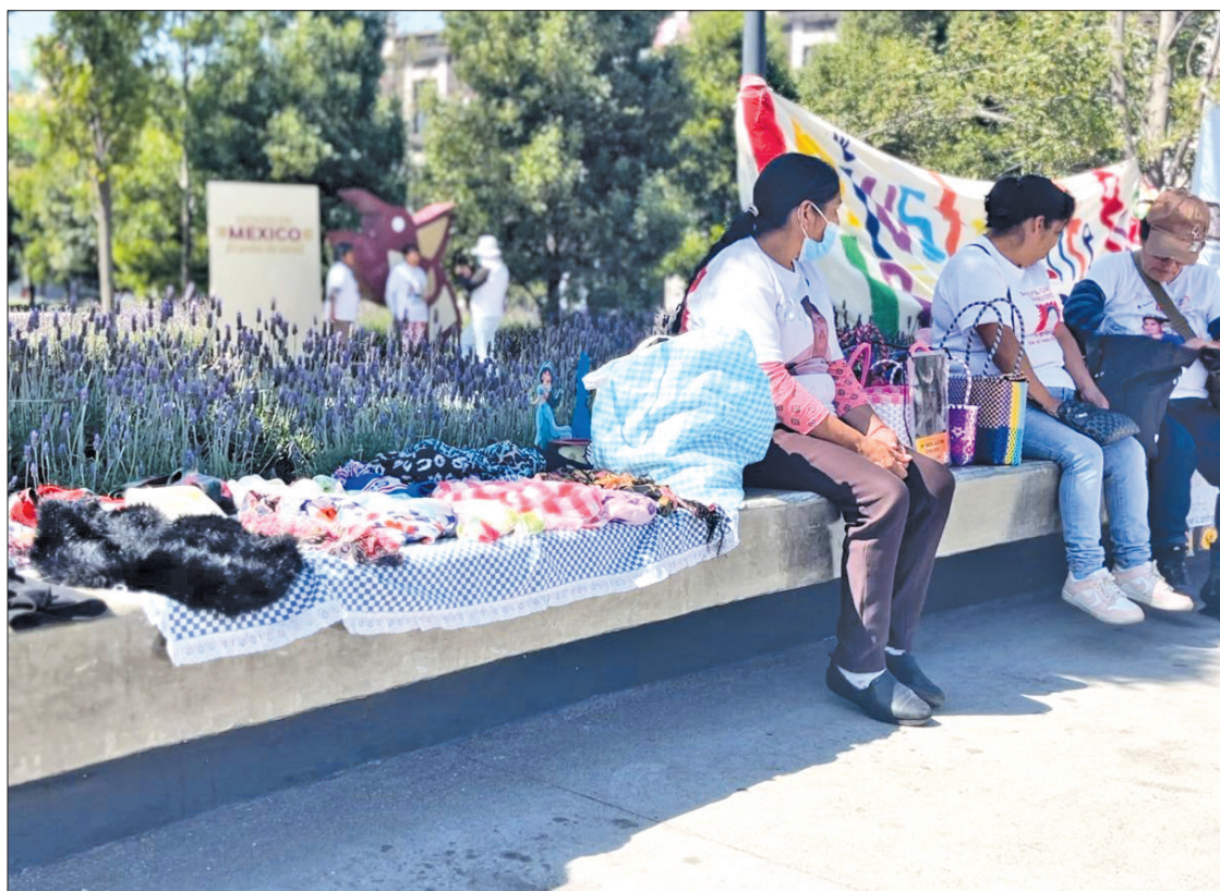
◀ El colectivo permaneció casi un año en plantón, frente a Palacio de Gobierno, en protesta por el injusto encarcelamiento de sus familiares.

Además de la protesta, la “mercadita” tiene un objetivo económico. Según Montoya, el colectivo también busca recaudar