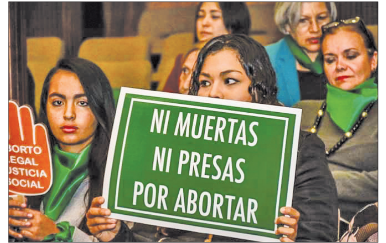
▲ En México, 14 estados han aprobado la ley de aborto. En el Edomex se propuso hace 17 años, lo que refleja un atraso en el tema.