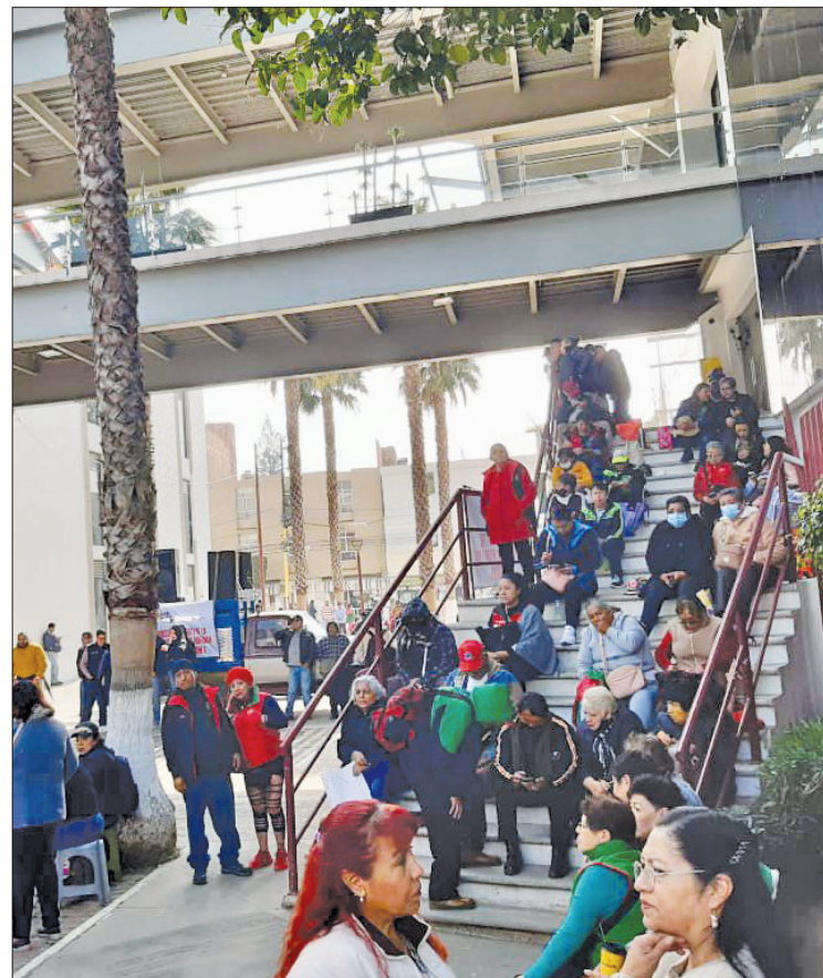
▲ Los trabajadores adscritos al SUTEYM se concentraron afuera de las distintas oficinas del gobierno local.