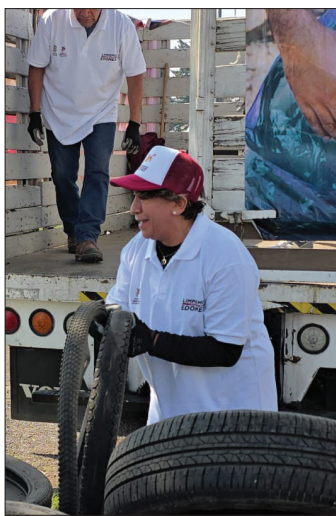
▲ La mandataria comentó que las siguientes campañas serían para recolectar pet y limpiar espacios públicos.

Gómez Álvarez llamó a la ciudadanía a reportar los neumáticos abandonados a través del sitio www.limpiemos.edomex.gob.mx