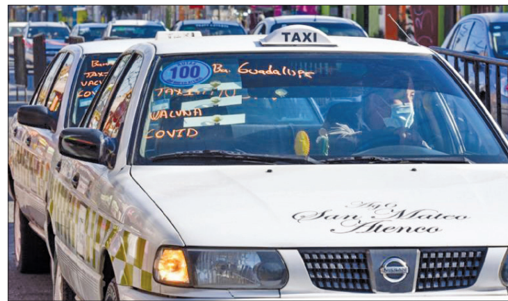
▲ Mediante un convenio, el gobierno mexiquense y NAFIN aportarán bonos de chatarrización de 125 mil pesos para adquirir autos híbridos y 160 mil pesos, para eléctricos.

Enfatizó en que la mayoría de los corralones son piratas, no cuentan con la normativa que establece la norma técnica como 5 mil metros cuadrados, bardas, permisos, estar dados de alta en el SAT, entre otros trámites.