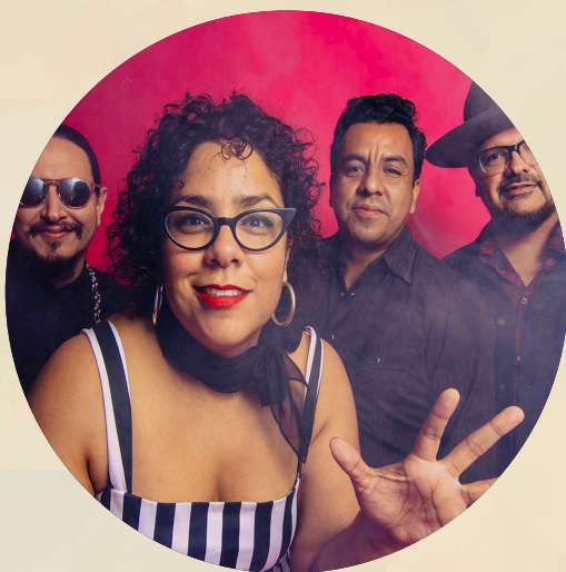
La Santa Cecilia