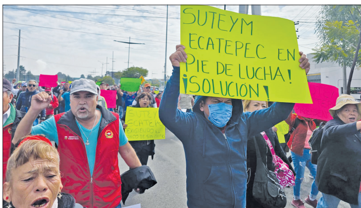
▲ Funcionarios públicos de Ecatepec marcharon por las calles de Toluca rumbo al Palacio de Gobierno, pero no los atendieron

frente al palacio municipal en las oficinas centrales de los Servicios de Agua Potable, Alcantarillado y Saneamiento de Ecatepec (Sapase), así como en el Sistema DIF.