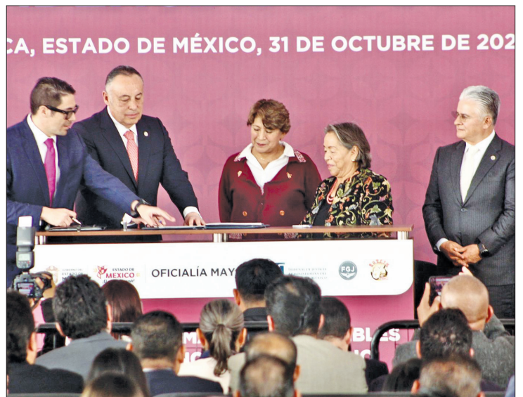
▲ La gobernadora del Estado de México, Delfina Gómez Álvarez, dijo que entregará las escrituras de posesión legal de los inmuebles.

breve entregará las escrituras de posesión legal.