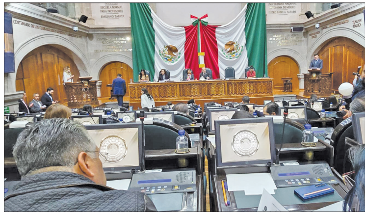
▲ Diputados de oposición aseguran que esta votación calla las voces de otras fuerzas políticas.

Oposición en Congreso argumenta que la aceptación concentra poder y elimina los contrapesos en México