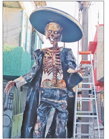
▲ El Charro Negro recorrerá las calles de Texcoco este 1 de noviembre en la tradicional caravana de Día de Muertos.

Cuenta la historia que el hombre intentó huir de su deuda montado en su caballo y con una bolsa llena de monedas de oro para que el Diablo no se lo quitara; sin embargo, el acreedor lo alcanzó y desde aquel entonces fue condenado a vagar