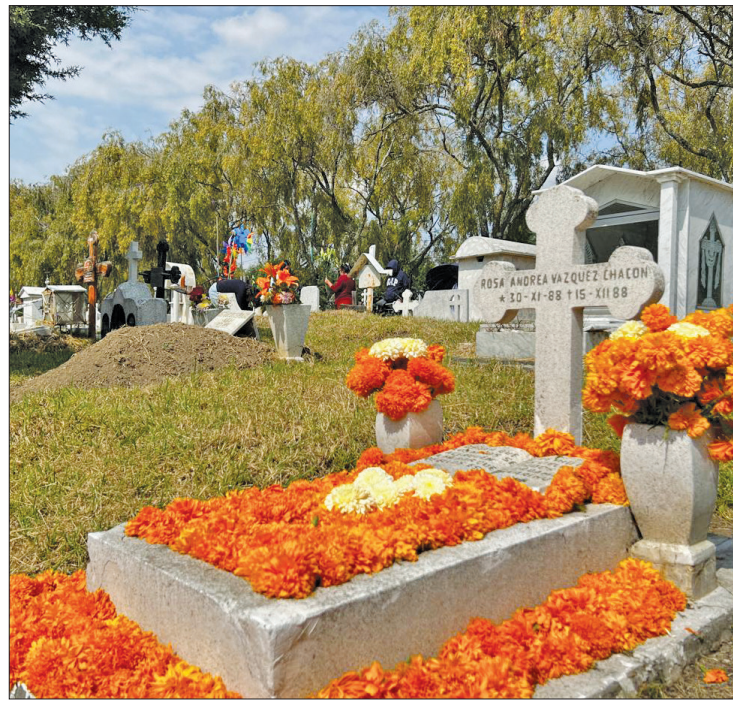
▲ Hacén falta espacios para el descanso eterno de los habitantes del valle de México.