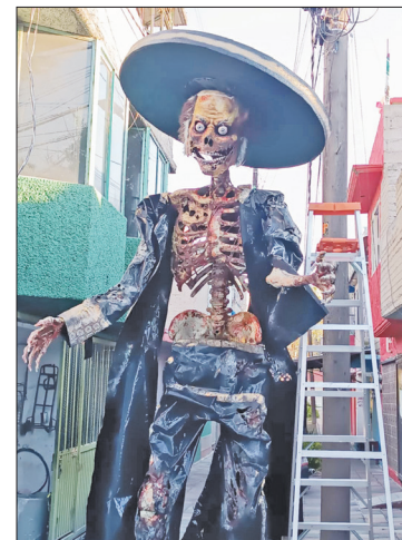
▲ El Charro Negro recorrerá las calles de Texcoco este 1 de noviembre en la tradicional caravana de Día de Muertos.

Cuenta la historia que el hombre intentó huir de su deuda montado en su caballo y con una bolsa llena de monedas de oro para que el Diablo no se lo quitara; sin embargo, el acreedor lo alcanzó y desde aquel entonces fue condenado a vagar