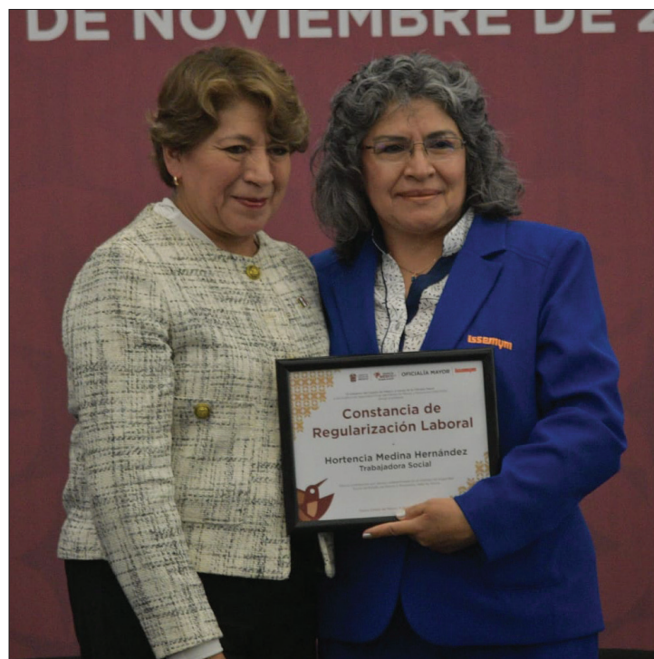
◀ La gobernadora Delfina Gómez entregó a trabajadores del ISSEMyM la constancia de actualización de plazas a personal de salud, administrativo y de apoyo.

“No es resultado de una persona, no es gracias a la gobernadora, es gracias a un equipo, empezando por nuestros ciudadanos, a través de sus impuestos nos hacen llegar los recursos. A nosotros lo que nos toca administrar y generar espacios para usarlo adecuadamente”, declaró.