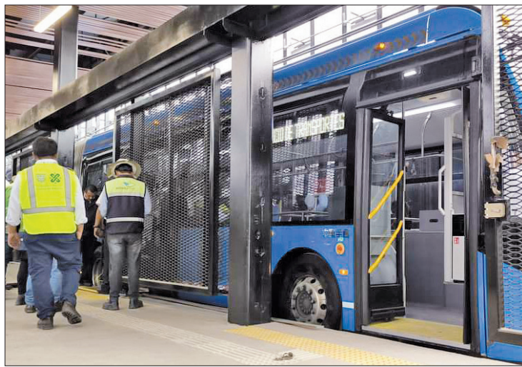
El Servicio de Transporte Eléctrico busca operadores para atender la reapertura de rutas, en particular, la nueva que correrá del municipio de Chalco a Santa Martha.

Agregó que los aspirantes deberán cumplir con una serie de