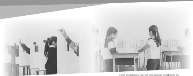
Estas imágenes fueron generadas mediante IA.