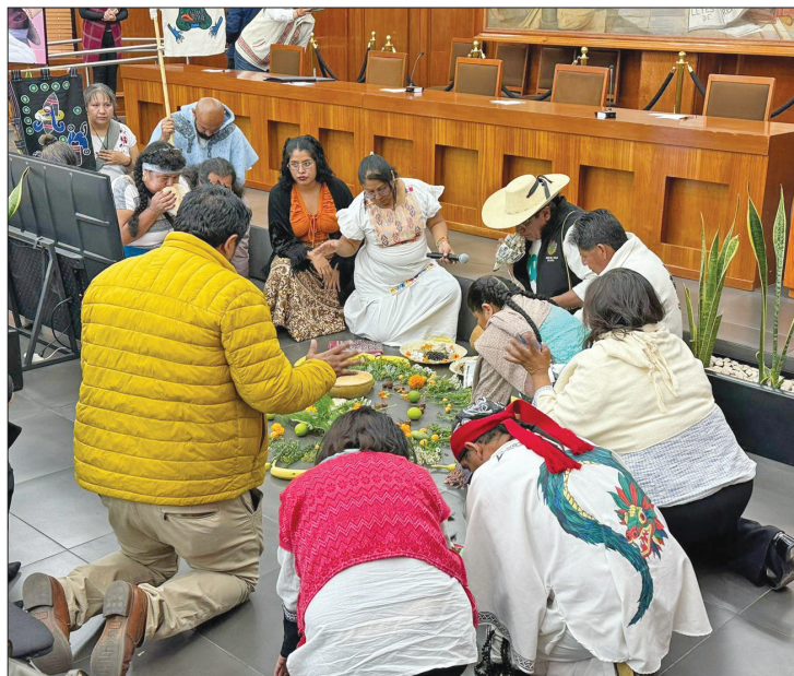
◀ Miembros de los cinco grupos indígenas en el Estado de México comenzaron su participación en el foro convocado por la legislatura local, con una ceremonia, parte de su cosmovisión.

El Censo Poblacional Inegi 2020 arrojó que hay 417 mil 603 personas de los pueblos originarios Mazahua, Otomí, Nahuatl, Matlazincas y Tlahuicas.