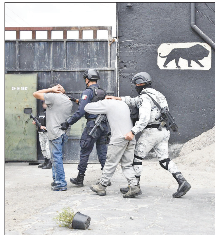
▲ La SSEM aseguró ejemplares de diversas especies de mamíferos durante un cateo a un inmueble en Ocoyoacac, cuatro de los detenidos también están vinculados al delito de secuestro. Foto especial

En el operativo participaron elementos de la Secretaría de la Defensa Nacional (Sedena), Guardia Nacional (GN), y Fiscalía General de Justicia del Estado de México (FGJEM).