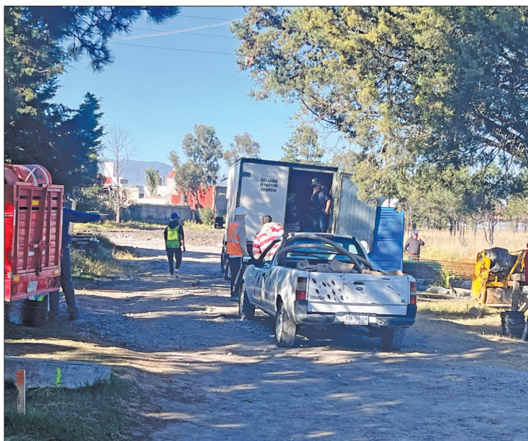
◀ La obra fue suspendida por supervisión del Instituto Nacional de Antropología e Historia (INAH) por hallazgos de vestigios arqueológicos, además del daño a la flora y fauna del Parque Sierra Morelos, en Toluca.

Pese a inspecciones del INAH, la construcción del Centro de Bienestar Animal se llevó a cabo durante varias semanas; no hay propuestas de reubicación