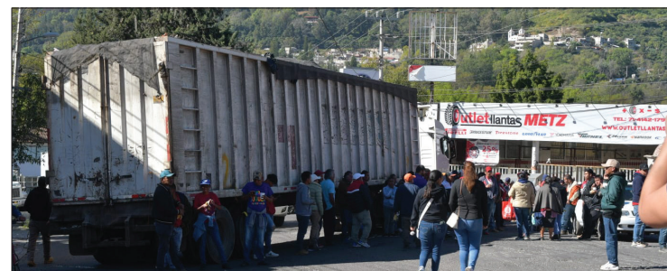
▲ Pobladores de Santa Ana Tenancingo, lograron que cinco personas acusadas de extorsión fueran liberadas, aseguran que eran obligados por el crimen organizado a extorsionar comerciantes.

De acuerdo con la Secretaría de Seguridad (SS) la captura de estas personas fue derivado de una llamada de denuncia.