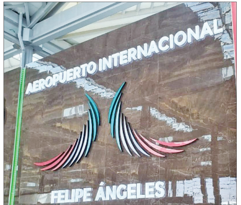
▲ El Aeropuerto Internacional Felipe Ángeles (AIFA) fue inaugurado el 21 de marzo de 2022.

El AIFA se destacó por su diseño, el cual incluye una torre de control inspirada en el macuahuitl, un arma azteca, así como por la representación de elementos culturales como la Piedra del Sol en su decoración interior.